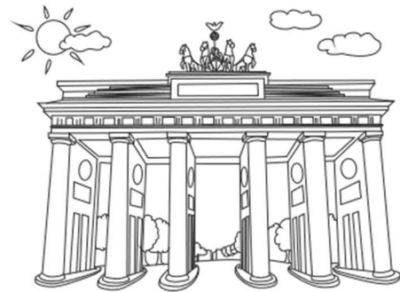
Welche Wörter könnten thematisch zu diesem Bild passen?